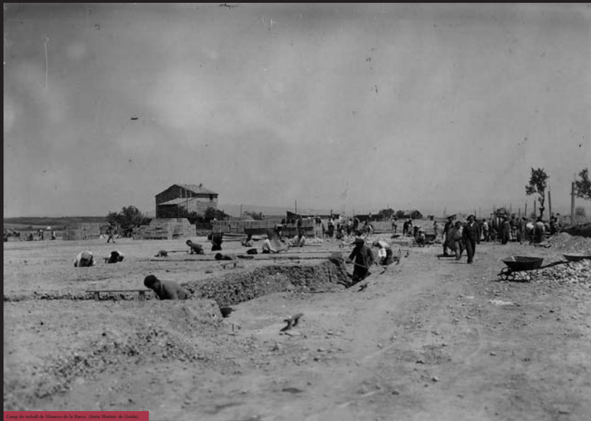
Camp de treball de Ylancosa de la Barca, (Arxius Històrics de Casolà).

És important destacar que alguns camps passaran a ser presons per engolir el brutal volum de presos, però sobretot que la improvisació en l'organització d'aquests camps i la lentitud burocràtica en la classificació de presos van dificultar encara més la vida diària en aquests centres. Un dia a dia ple també de "reeduació" cap a la ideologia única del règim i expiació de la culpa a través del treball obligatori pels penats en aquests centres.