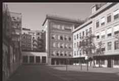
INSTITUT MIGUEL DE UNAMUNO (Madrid)