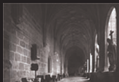
MONASTIR DE SAN MARCOS (Lleó)