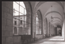
MONASTIR DE LA SANTA ESPINA (Valladolid)