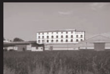
SAN JUAN DE MOZARRIFAR (Saragossa)